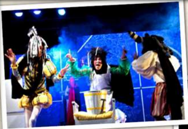
Romeo y Julieta